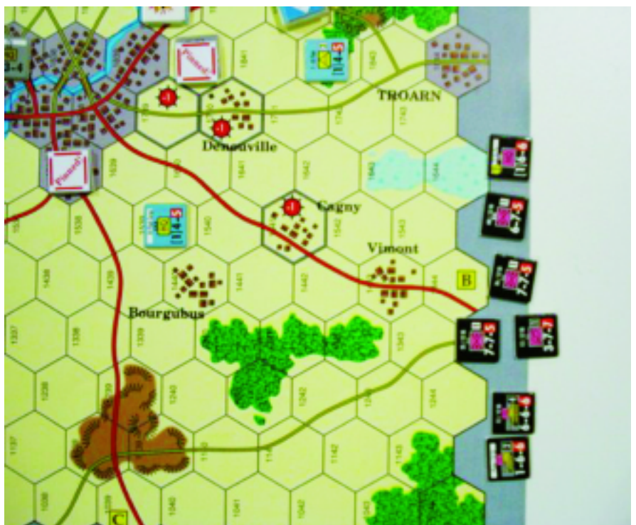
La 12 e SS n'entre pas en scène le 6 juin.