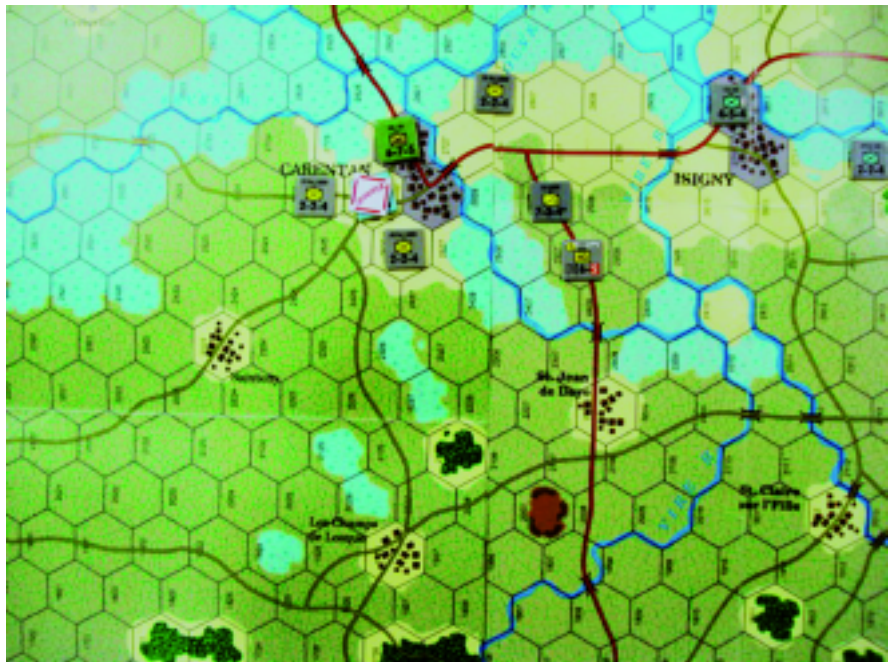
Coup de main à Carentan.

Joueur américain, je me plonge dans des documents historiques ( http://cgsc.leavenworth.army.mil/carl/contentdm/home.htm , cherchez « Neptune ») pour comprendre ce que voulaient faire les acteurs. Mon G2 et celui des Britanniques estiment que l'Allemand va sortir ses trois divisions du Cotentin et n'y laisser que la garnison de Cherbourg, faire de Carentan une place forte avec ses parachutistes (6. FJR), tenir Isigny et l'Aure, créer un front dans le bocage au sud de Bayeux et dans la ceinture fortifiée de Caen. Nous craignons surtout qu'il élimine les paras britanniques (6 e AB).